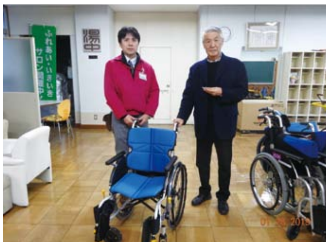
マックスバリュ東海小田原荻窪店様より車イスのご寄附。