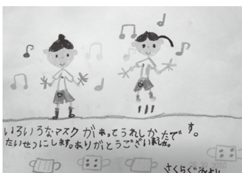
～マスクを寄附させていただいた小田原愛児園の児童より～