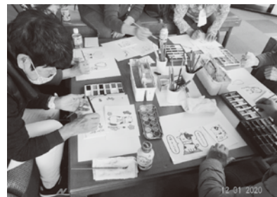
皆さんとってもお上手でした！