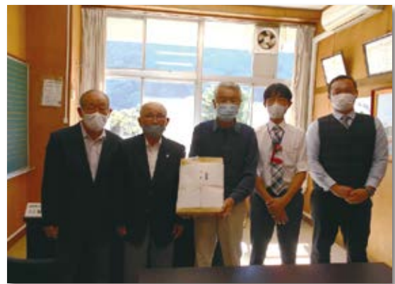
老人クラブ連合会様よりマスクの寄付を頂きました!