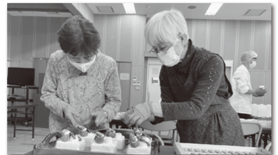
地域のボランティアさんも協力してくれました！

お申込みいただいた皆様、ご協力いただいた地域の皆様、本当にありがとうございました！