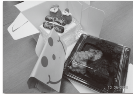
ケーキ、からあげ、ポテト！

春に中学生になって、「君からクリスマスカードをもらったよ」なんて、会話の種になり、新しい友達ができたらいいな～と思います★