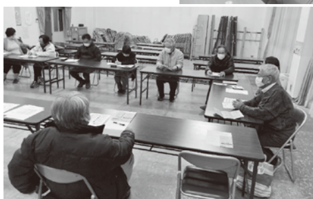
宮城野話し合う会