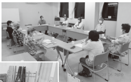
仙石原話し合う会

自治会・民生委員・老人クラブ・消防団等のみなさんで地域が暮らしやすくなるよう、話し合っています。