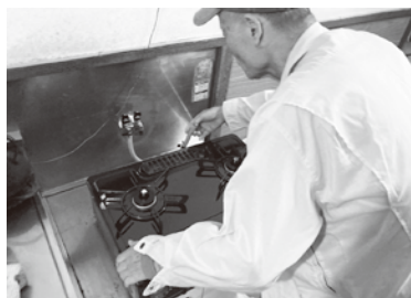
ガスコンロのホース交換

町内には多くの「たすけあい活動」の担い手の方々がいらっしゃいます。「お願いしたい人」と「たすけられる人」をつなぐ（マッチング）ことも生活支援コーディネーターの役割です。