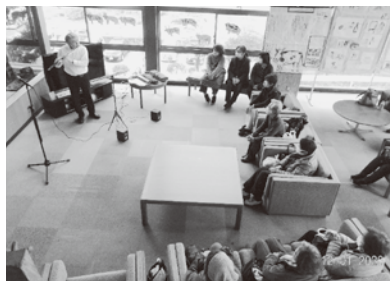
フルーツミニコンサート!!