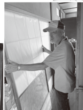
ふすまの入れ替え