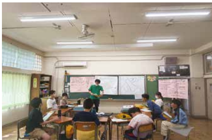
(街歩き事前学習の様子)