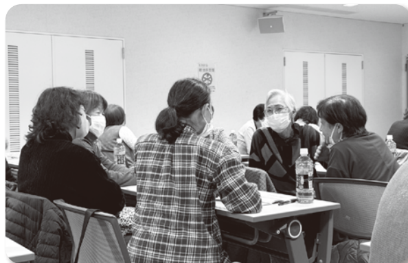
(アイスブレイクの様子)