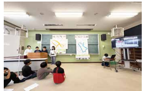
(完成発表会の様子)