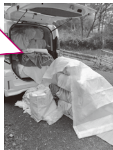
（捕獲した猫を運搬する様子）

運搬する際はゲージごとに布で包むことにより、 ①猫自身が落ち着くこと、 ②ノミ・ダニが他の猫に移らないようにしています。