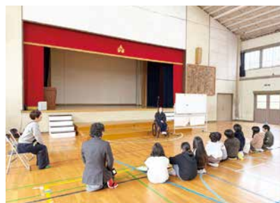
(車いす体験の様子)