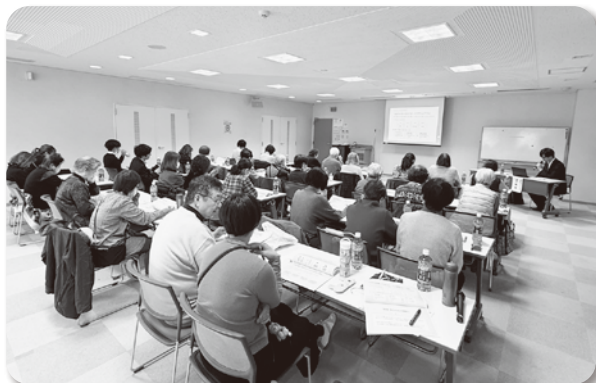
(講師の話を聞く様子)

受講者からは、「今一度地域のことを考えるきっかけになった」、「孤独・孤立を地域で生まないために、日頃からお互いが地域で気にかけてあげるようにしたい」等の声があり、日々地域で活動するにあたり有意義な研修となりました。