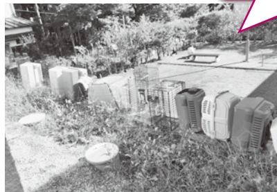
（TNRをする際に使用するゲージ等）

運搬する際はゲージごとに布で包むことにより、 ①猫自身が落ち着くこと、 ②ノミ・ダニが他の猫に移らないようにしています。